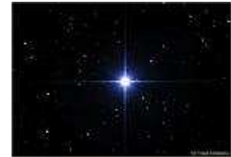
Détail de Rigel